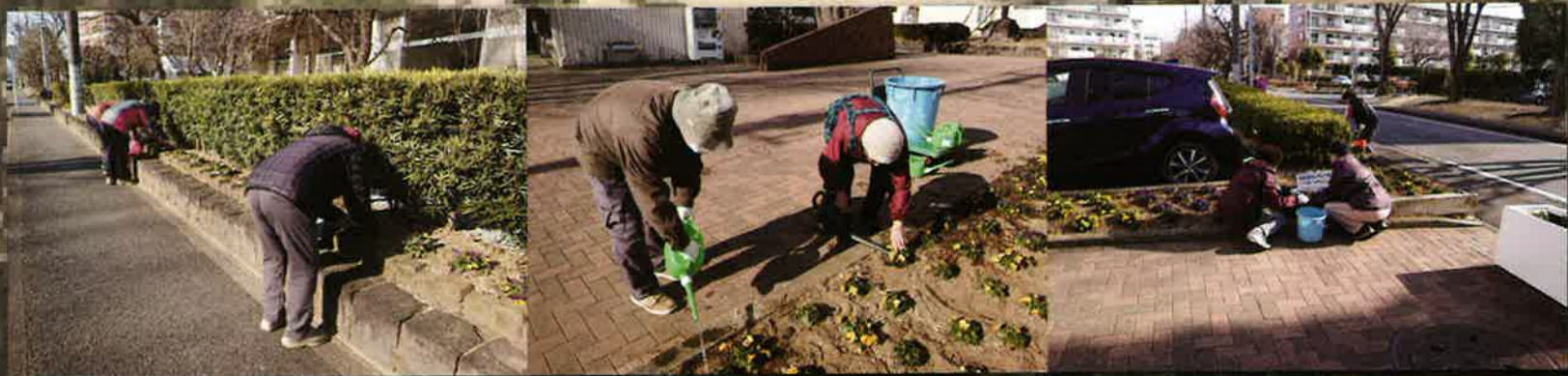
春の準備(若一フラワークラブ)