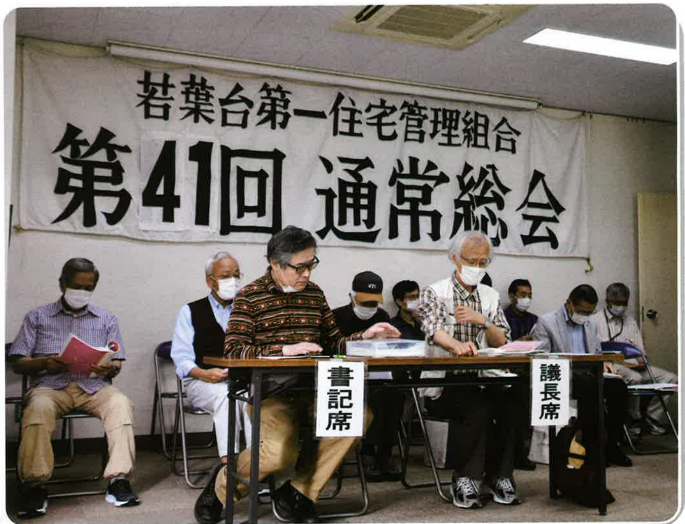
昨年度(第41回通常総会)の様子