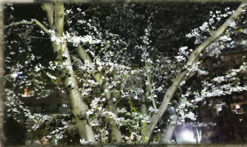
上・左3枚…「石の山」の桜 下…10号棟側の桜