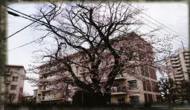
第179号『団地の銘木』で紹介した桜

昨年から、続いている新型コロナウイルスの感染拡大：・そんな中でも、春は訪れます。別れの春。新出発の春。様々な春があります。今回は、桜を中心に団地の春風景をご紹介します。