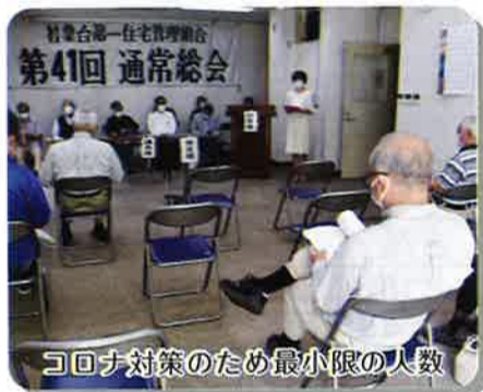
第41回 通常総会 コロナ対策のため最小限の人数