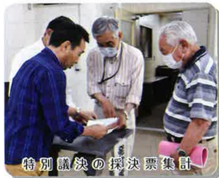
特別議決の採決票集計