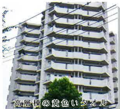
高層棟の黄色いタオル