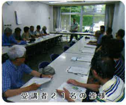
救急隊員からの解説 受講者21名の皆様

技能維持のため、2、3年毎の再受講が推奨されているが、できる限り積極的に参加したい。講習当日は参議院選挙の日でもあった。若者の投票率の低さが話題になっているが、今日の講習も含め、若い人たちが積極的になってくれるといいなと思う。