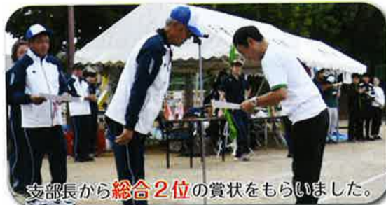
支部長から総合2位の賞状をもらいました。