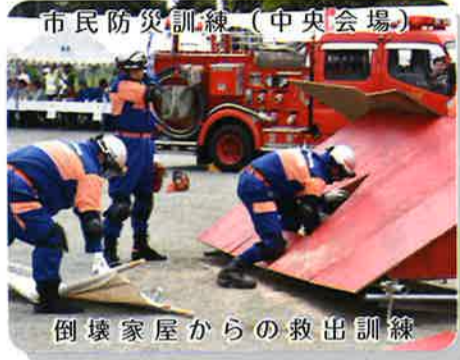
市民防災訓練（中央会場） 倒壊家屋からの救出訓練