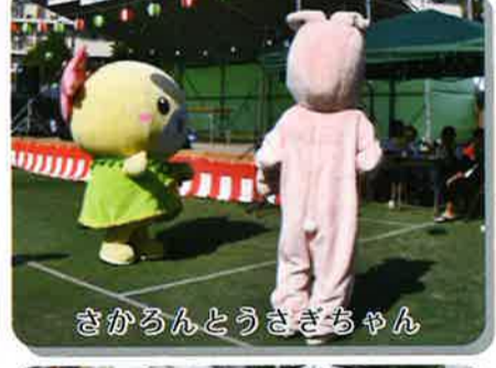
さかろんとうさぎちゃん