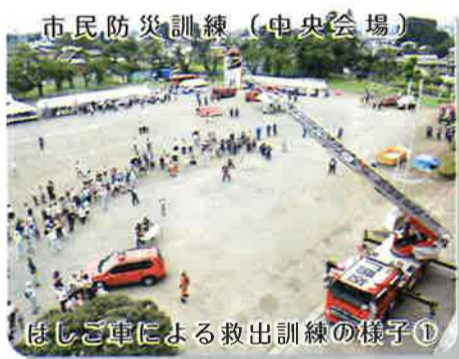
市民防災訓練（中央会場） はしご車による救出訓練の様子①