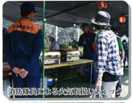
消防隊員による火気取扱いチェック