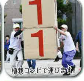
植栽コンピで運びませう。