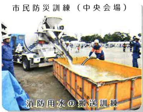
市民防災訓練（中央会場） 消防用水の搬送訓練

訓練は、『地域防災計画に基づき、大規模地震災害・風水害等に備えて各種訓練を実施し、防災体制の確立と防災活動に関する理解を深める。』を目的とし、中央会場の大家小学校では、この地区の自主防災組織および学校関係並びに近隣の企業が訓練を行い、全市で