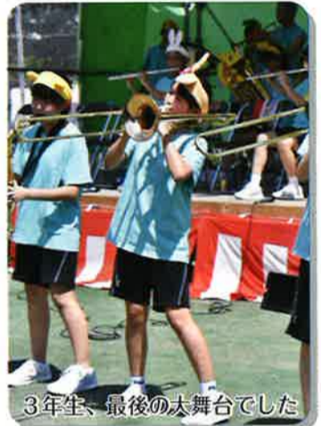
3年生、最後の太舞台でした