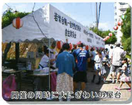
開催の同時に大にぎわいの屋台