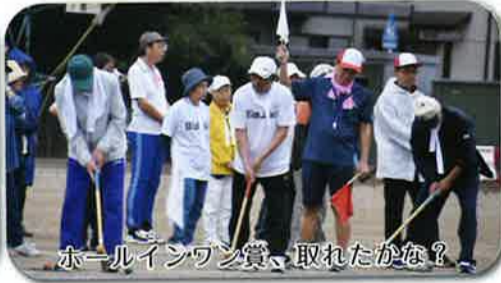
ホールインワン賞、取れたかな?