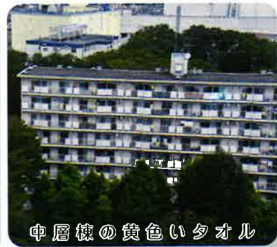
中層棟の黄色いタオル

を差し伸べることが出来るのではと考えます。この度の防災訓練では、大勢の方々の参加を頂き、また、積極的な行動により、ポリウムある訓練内容を、無事終了することができましたことに感謝申し上げます。