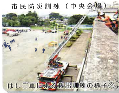
市民防災訓練（中央会場） はしご車による救出訓練の様子②