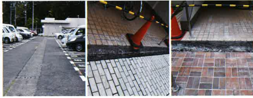
修繕前 修繕前 修繕前 駐車場区画線補修後

今後の対応は、棟共用部ですので、その都度対応を検討していきます。段の鼻先の部分については、工場で作られたコンクリートの既製品です。