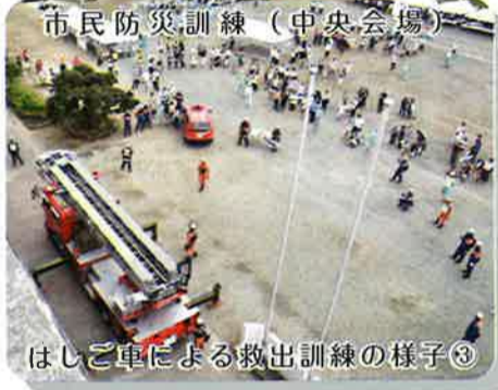
市民防災訓練（中央会場） はしご車による救出訓練の様子③