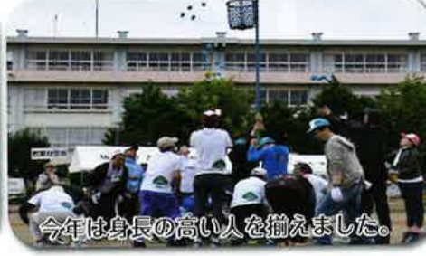
今年は身長の高い人を揃えました。