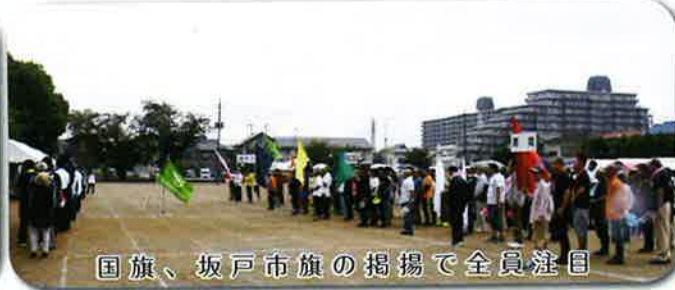
国旗、坂戸市旗の掲揚で全員注目