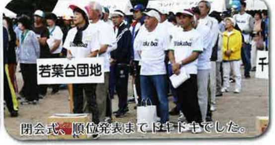
閉会式、順位発表まで13分過ぎました。