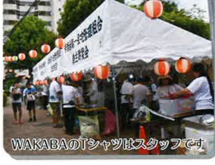
WAKABAのTシャツはスタッフです