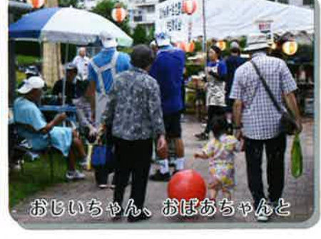
おじいちゃん、おばあちゃんと