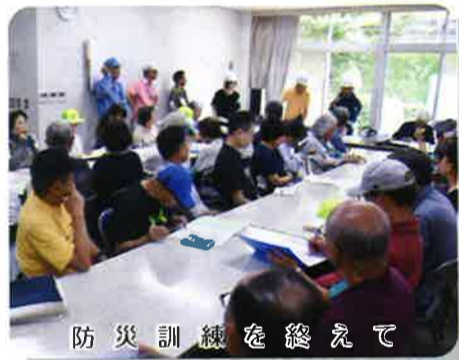
防災訓練を終えて