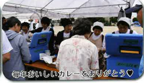
毎年おいしいカレーをありがとう♡