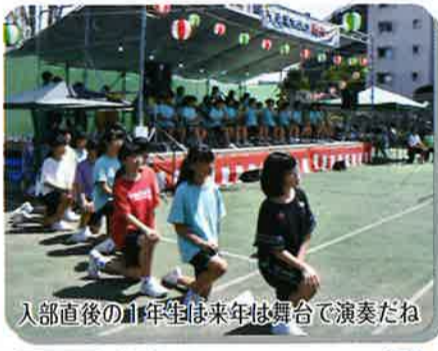
入部直後の1年生は来年は舞台で演奏だね