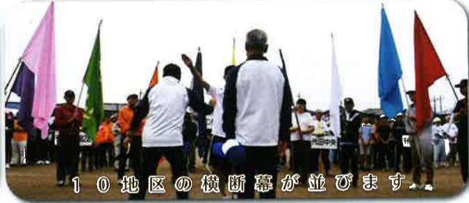
10地区の横断幕が並びます。