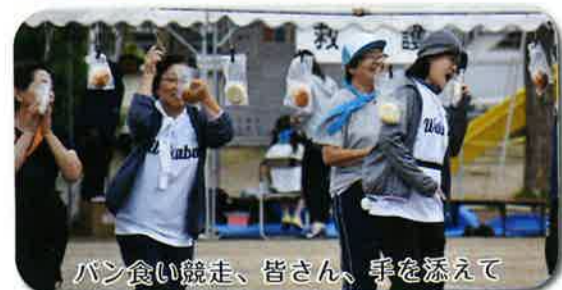
パン食い競走、皆さん、手を添えて