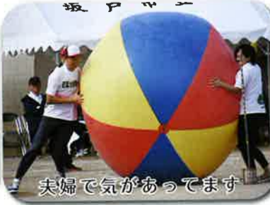
夫婦で気があってます