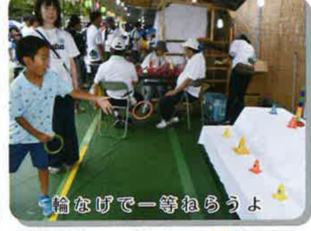
輪なげで一等ねらうよ