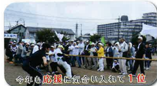
今年も応援に気合い入れて1位