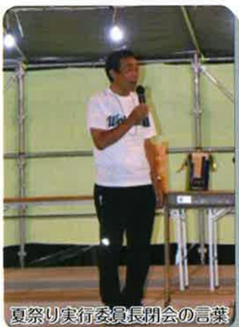
夏祭り実行委員長閉会の言葉