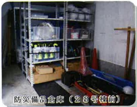
防災備品倉庫（28号棟前）