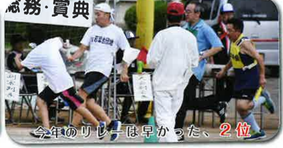
今年のリレーは早かった、2位