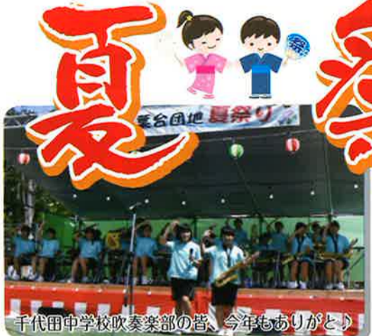
千代田中学校吹奏楽部の皆、今年もありがとう