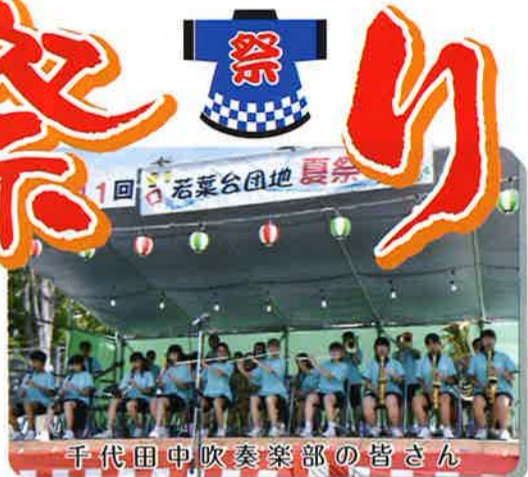
千代田中吹奏楽部の皆さん