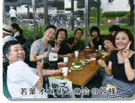
若葉オカリナの会の皆様