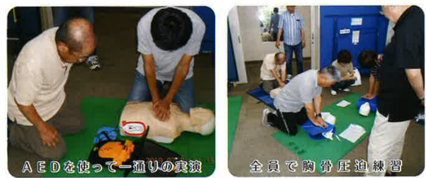
AEDを使って一通りの実演 全員で胸骨圧迫練習

というとき大丈夫!!」といった自信はない。初めは時間短縮を願っていたが、心肺蘇生のところはあと数回は落ち着いておさらいしてみたいくらいだ。