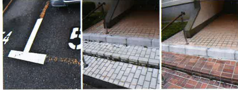
修繕後 修繕後 修繕後 駐車番号標示補修後