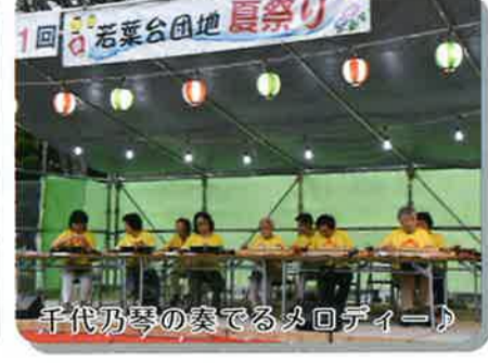
千代乃琴の奏でるメロディー