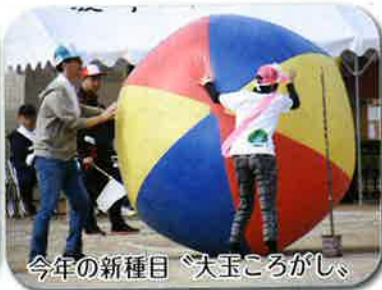
今年の新種目「大玉ころがし」