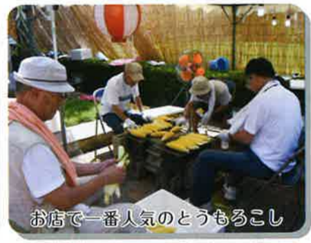
お店で一番人気のとうもろこし