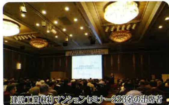
建設工業(株)マンションセミナー223名の出席者