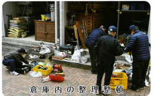
倉庫内の整理整頓