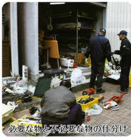
必要な物と不必要な物の仕分け

施設協力会はどなたでも参加可能ですので、興味のある方、健康維持のため体を動かしたい方、未経験者でも可能です。管理事務所までご連絡お待ちしております。