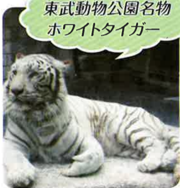
東武動物公園名物 ホワイトタイガー