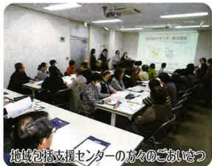
地域包括支援センターの方々のごあいさつ