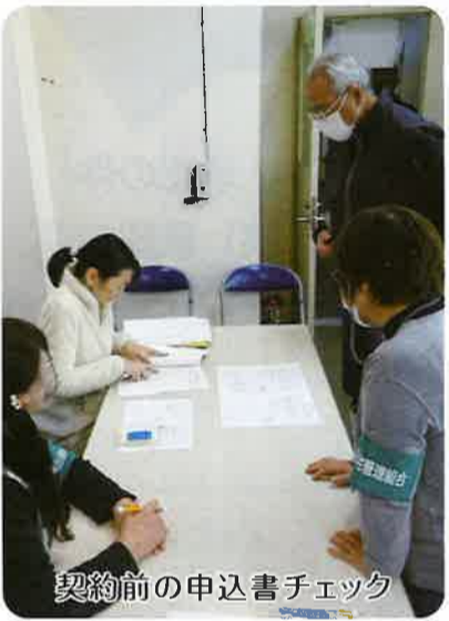
契約前の申込書チェック