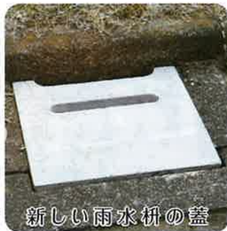
新しい雨水枘の蓋