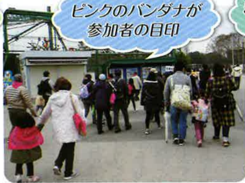
ピンクのバンダナが 参加者の目印