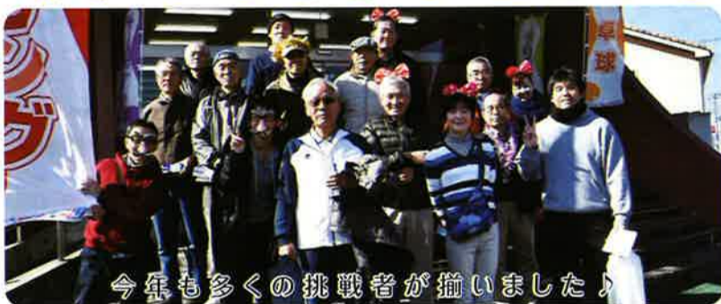
今年も多くの挑戦者が揃いました♪