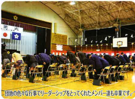
団地の色々な行事でリーダーシップをとってくれたメンバー達も卒業です。

春、穏やかな光に包まれて、ぼくは今日、南小学校を卒業しました。振り返ると、様々な思い出が浮かんできます。辛かったこと、嬉しかったこと、楽しかったこと。僕たちはたくさんの方々を支えられながら、ここまで成長することができました。本当にありがとうございました。 これからも、地域の皆さんの温かい応援と見守りを、宜しくお願いします。日本の若葉台団地になるように、僕たちも協力したいです。