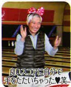
良いスコアに自分で手をたたいた♡笑