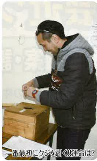
一番最初にクジを引く運命は?