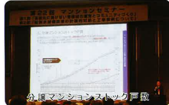
分譲マンションストック戸数