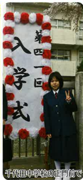
千代田中学校の正門前で

私は小学校で学んだことを中学校生活にもつなげて頑張ります。一日一日を大切にしながら、中学校生活を送っていきます。