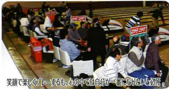
笑顔で楽しくプレーするも、心の中で自分一番だったと涙。