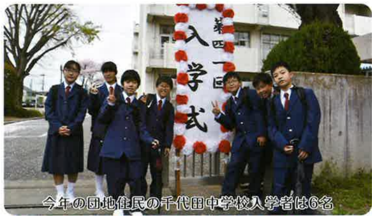
今年の団地住民の千代田中学校入学者は6名

6年間、私は、友達や先生、家族、地域の方々に支えられ、ここまで成長し、楽しい学校生活を送ることができました。4月からは中学生ですが、南小で学んだことを繋げ、卒業・入学という節目を境に、未来に向かって大きく成長していきたいです。