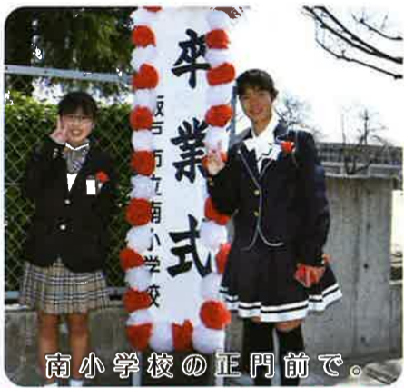
南小学校の正門前で。

私は、6年間皆勤で無事卒業することができました。1年生の最初の頃はドキドキしていたけれど、友達もでき、先生とも仲良くなり、地域の方々や見守り隊の方々が声を掛けてくれ、学校が大好きでした。学校ではたくさん勉強をして、心の底から話し合える友達ができ、最高の思い出を作ることができました。家庭面でサポートしてくれたお母さん、学校面で支えてくれた先生や友達、団地の皆様方、本当にありがとう。