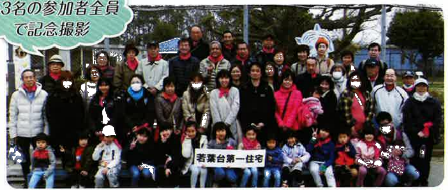
53名の参加者全員 で記念撮影