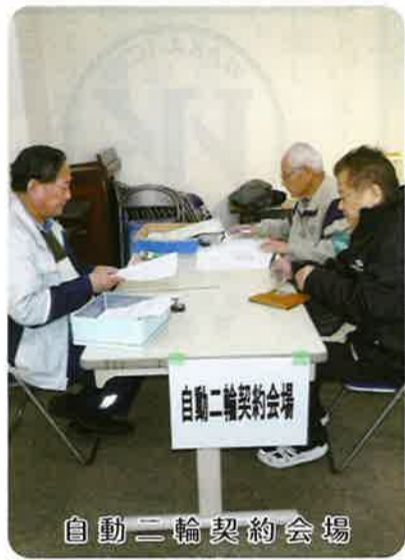
自動二輪契約会場