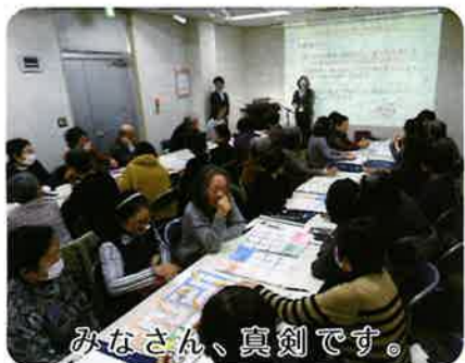
みなさん、真剣です。

昨日では、百歳時代といわれ、健康寿命を延ばすための、運動・食事・ストレスを軽減するための努力をされている方も多くいます。10年先の、当団地の超高齢化社会を迎えるにあたり、講座で学んだことを生かし、当団地の皆様とコミュニケーションを取りながら地域としての取り組みを考えようと思えます。