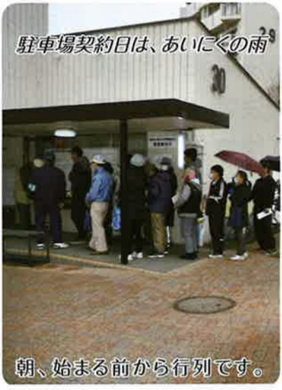
駐車場契約日は、あいにくの雨