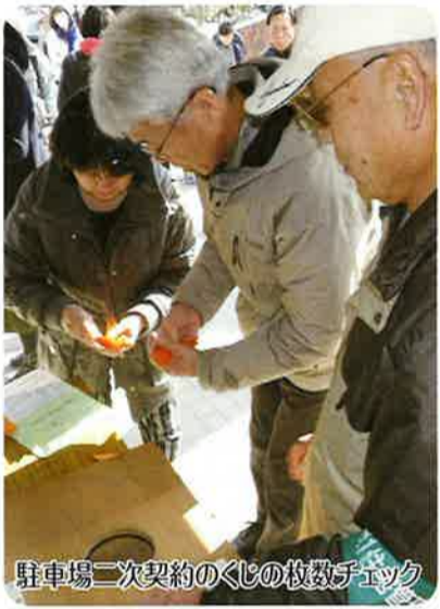
駐車場二次契約のくじの枚数チェック