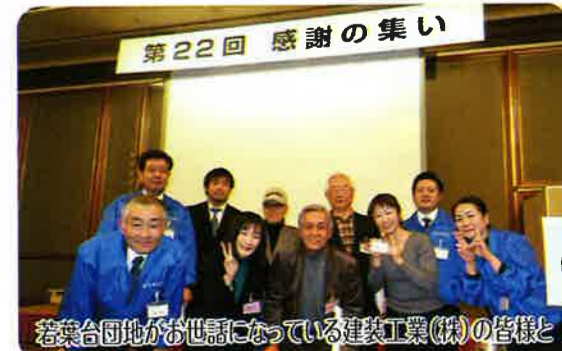
若葉台団地が世話になっている建設工業(株)の皆様と

建設工業主催のマンションセミナーが2月2日(土)に都内で開かれ、参加してきました。 建築工業(株)についてですが、団地内の施設関係でお世話になっている業者です。最近では旧バレーコートの子エンス張り替えや、徒渉池のプール補修、昨年度行われた、電気幹線設備改修工事に伴う建築工事などの対応をしていただいております。 さて、今回のセミナーの内容ですが、2部構成となっており、1部が『高齢化に負けない管理組合運営とコミュニケーション作り』、2部が『給排水設備改修の計画的対処と工事例について』でした。 まず管理組合運営に必要なのは合意形成力です。合意形成ができなければ意見は分かれ、運営が困難になります。その為には信頼される管理組合運営を築くこと、また日頃からイベント活動を通して 年代問わずコミュニケーションを図っていくことが大事です。管理組合は年配の方々から若い世代まで、様々な年齢層で成り立っています。その中で問題なのは高齢化。組合員の高齢化、役員の高齢化、居住者の高齢化、その中でも特に痛感しているのは、役員の高齢化です。現役で仕事をしている方でも、気軽に参加できる管理組合運営のために、メールやパソコン業務などをもっと取り入れ、本業をしながらでもやり取りできる環境作りが重要ということも学びました。 団地内の活動には、植栽協力会、施設協力会、組合運営協力会など、色々な住民の方とも力を合わせて取り組める機会がございます。協働に参加していただいて、コミュニケーションを図っていききたいと思っております。 次に、給排水設備に関してですが、今後は給排水管の老朽化が進み、色々な個所で交換が必要になります。排水管に限らず、建物の老朽化も進み、色々な問題が生じる可能性も考えられます。その為には、大規模修繕計画や中長期営繕計画をしっかり立て、積立金をしっかり備えて対応していくことが大事です。高齢化といわれる時代ですが、今後も建物の維持管理を、更に進めて参ります。自分達が住んでいる団地の積立金はいくらかあるのか、計画はどうなっているのか、住民一人一人が考えていくことで、より良い住環境を維持することが出来ます。住民の皆様もご協力頂いて、住みこちの良い団地を作り上げていきましょう。 今回セミナーに参加させていただき、団地に住んでいく上で、大変参考になる内容でした。参加させていただき、本当にありがとうございました。