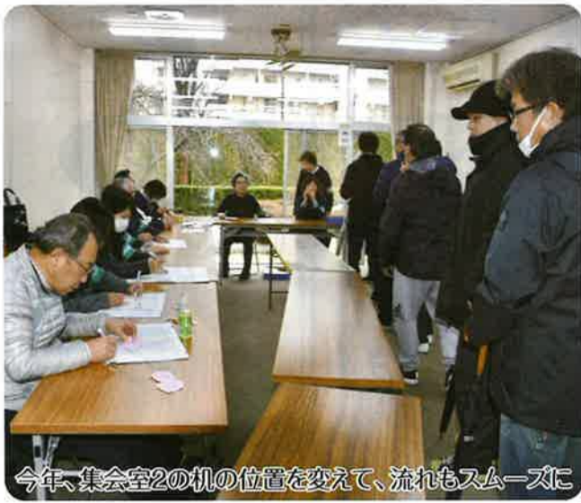
今年、集会室2の机の位置を変えて、流れもスムーズに