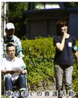
車いすでの救護活動