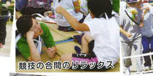
競技の合間のリラックス