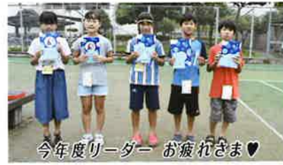
今年度リーダー お疲れさま♥