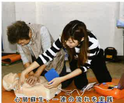
心肺蘇生、一連の流れを實踐

囲の人に救急車の通報とAEDの手配を依頼し、胸骨圧迫(心臓マッサージ)の心肺蘇生をしながら救急車の到着(平均約8~9分)を待つ。救命効果を高める「救命の連鎖」は4つの輪で成り立っていて、このうちの最初の3つの輪は、その場に居合わせた人により行われることで生存率を高め、AEDを使用し電気ショックを行った方が生存率や社会復帰が高いという説明を受けながら、3つの輪である①心停止の予防②早期認識と通報③心肺蘇生とAED、これについて一人ずつ体験し、その後の④救急隊や医師へ引き継ぐ大切さとAEDについて学びたい機会でした。