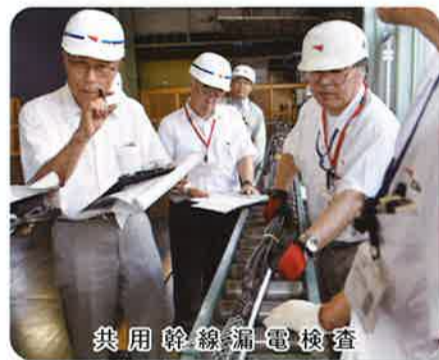
共用幹線漏電検査