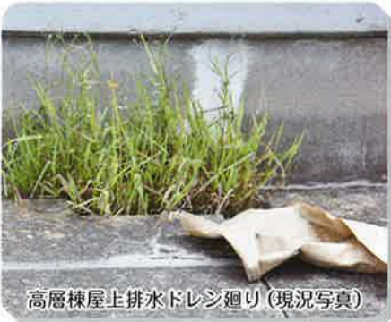
高層棟屋上排水ドレン廻り(現況写真)