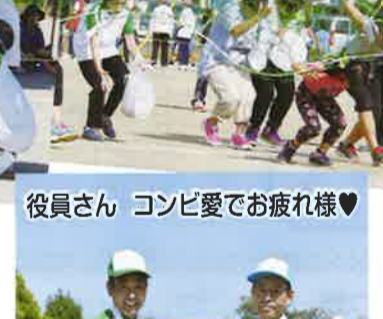
役員さん コンビ愛でお疲れ様♥