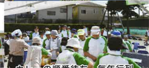
カレーの順番待ち。毎年行列