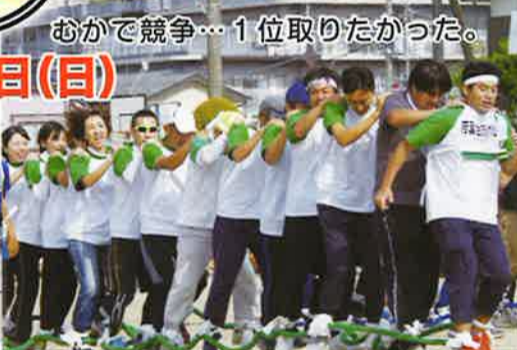
おかけ競争... 1位取りたかった。