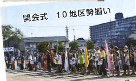
開会式 10地区勢揃い