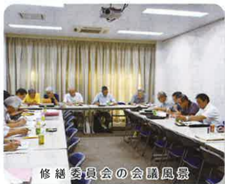
修繕委員会の会議風景