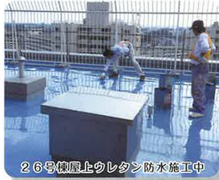
26号棟屋上ウレタン防水施工中