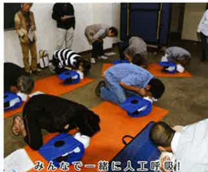
みんなで一緒に人工呼吸！