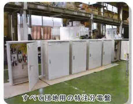
すべて団地用の特注分電盤