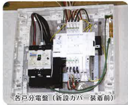
各戸分電盤(新設カバー装着前)