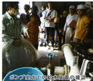
ポンプ室内での給水装置の確認