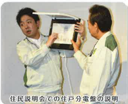
住民説明会での住戸分電盤の説明