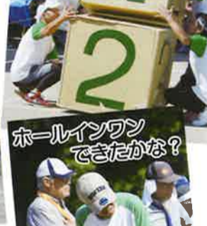
ホールインワンできたかな?