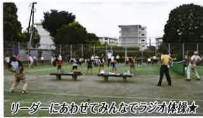
リーダーにおわせてみんなでラジオ体操☆