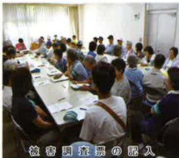
被害調査票の記入