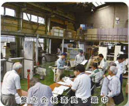
盤立会検査真っ最中