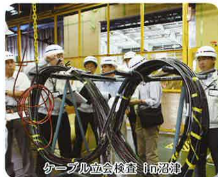
ケーブル立会検査 in 沼津