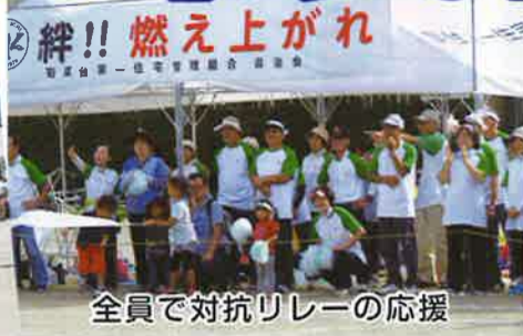
全員で対抗リレーの応援