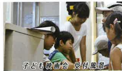
子ども映画会 受付風景