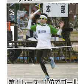
第1レース、1位でゴール