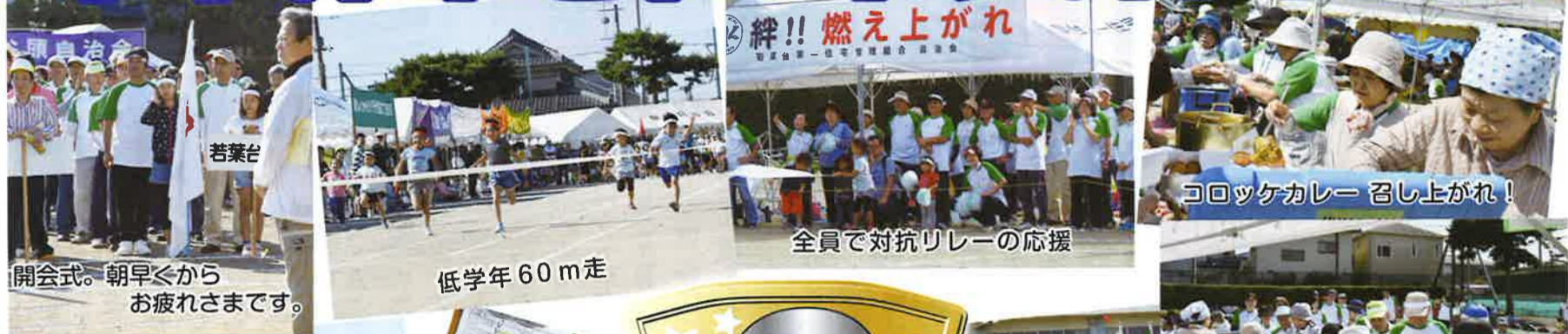
開会式。朝早くからお疲れさまです。