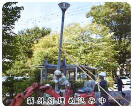
新外灯埋め込み中