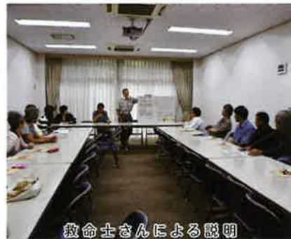
救命士さんによる説明