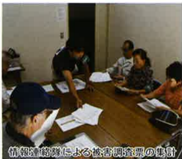
情報連絡隊による被害調査票の集計