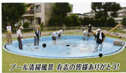
プール清掃風景 有志の皆様ありがとう!