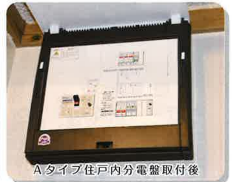
Aタイプ住戸内分電盤取付後