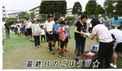
最終日のごほうび☆