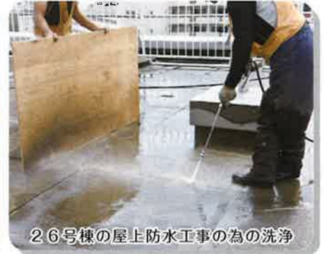
26号棟の屋上防水工事の為の洗浄