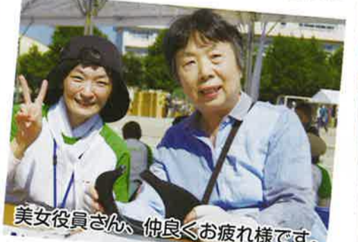
美女役員さん、仲良くお疲れ様です。