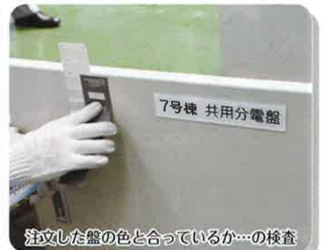
7号棟 共用分電盤 注文した盤の色と合っているか…の検査