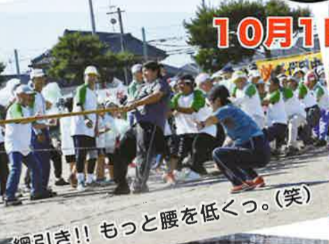
綱引き!! もっと腰を低く。(笑)