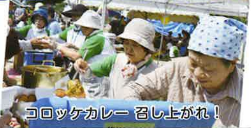
コロッケカレー 召し上がれ!