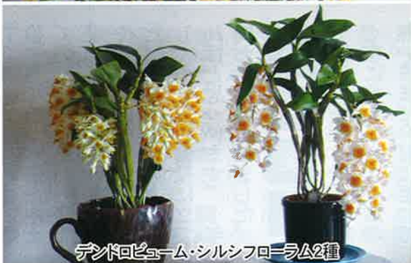
デンボロビュム・シルシフロラム2種