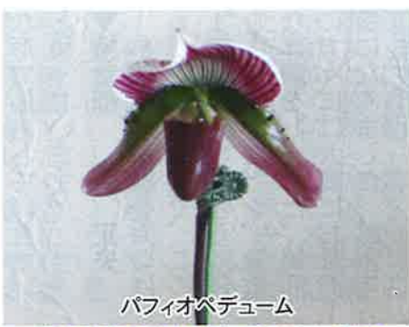
パフィオペデュム

ランといえど栽培が難しくそうですが意外と手間はかからないというお話でした。これからも益々きれいな花を咲かせてください。(広報 羽磨)