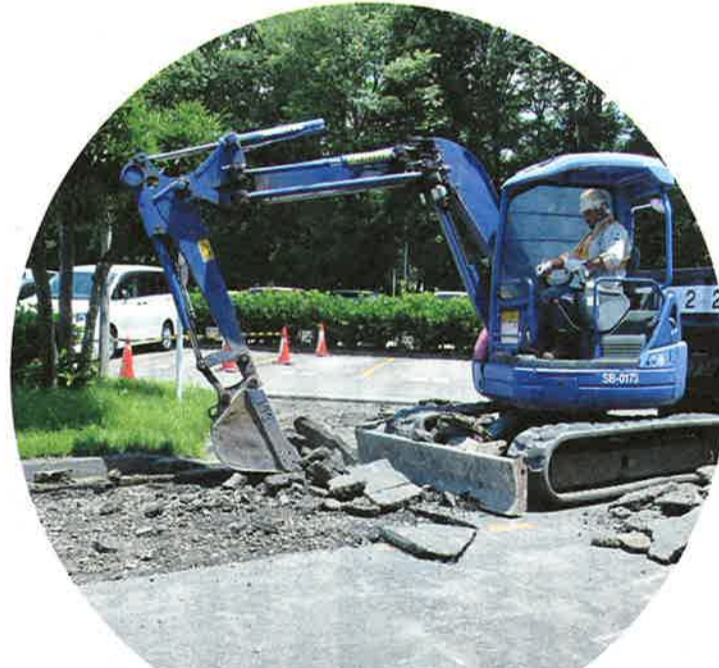
アスファルト補修工事

らこちらに傷みがありますがすべてを補修することは費用の関係でできませんので傷みの激しい箇所部分補修を行います。