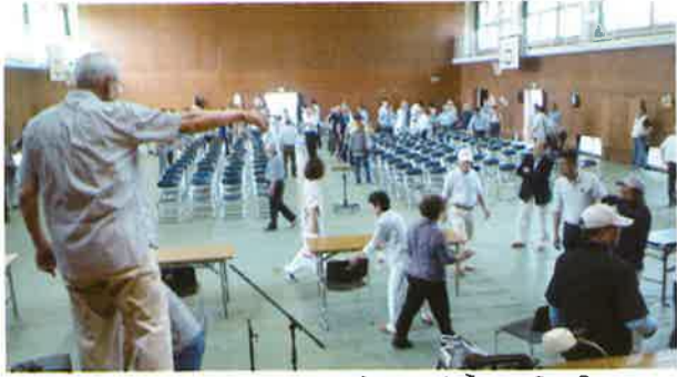
ご協力ありがとうございます