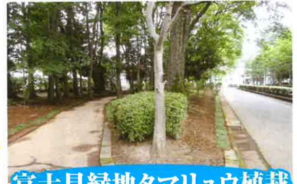
富士見緑地タマリユ植栽