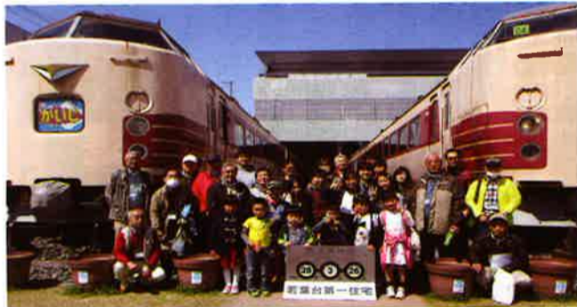
「春のバスハイキング」 大宮鉄道博物館にて

「かつこいいね。こんなのがせんろを走つていたんだね。」 と言いました。むかしの人たちが作つたんだとかがえるとおもいました。その後もきつぷやしよう車けんをきつてもらつたり、パソコンですきな形の電車を書きました。かつこよくできたのでよかったです。 また来年もバスハイキングにいきたいです。