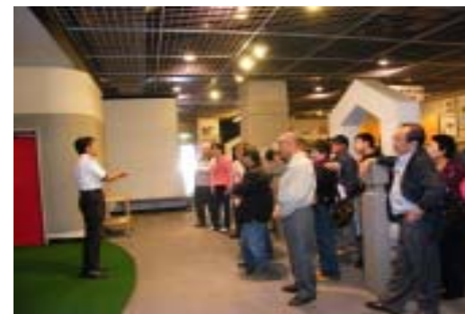
10月11日防災学習センターにて

9月12日(土)の夜間防犯パトロールは雨天のため中止し、9月25日(金)の1回にのみになりました。